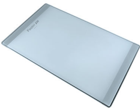
Tabla de corte de cristal 8631 300